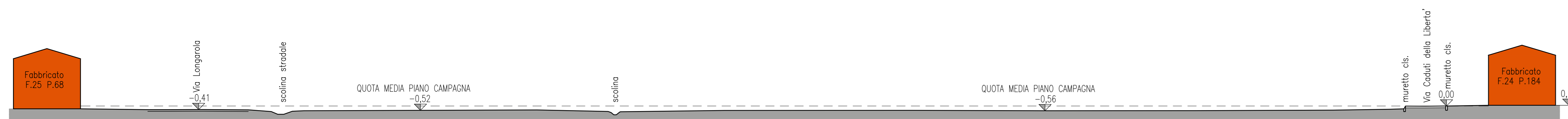
SEZIONE A-A 1:---